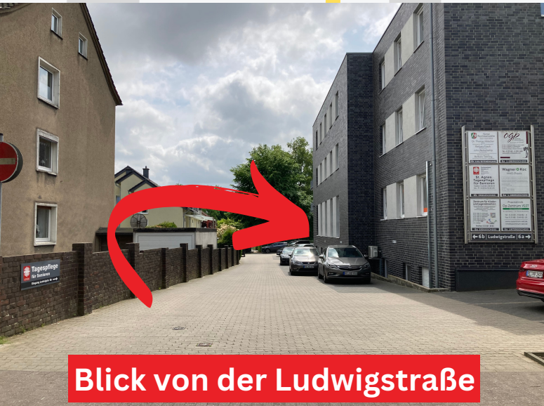
Blick von der Ludwigstraße